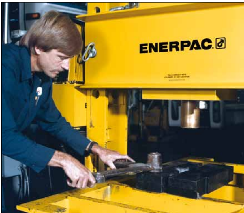
▲ Пресс BPR-20075 помогает извлечь большой вал из опорного блока. Конструкция с подвижной станиной позволяет безопасно загрузить тяжелые детали с использованием мостового крана.